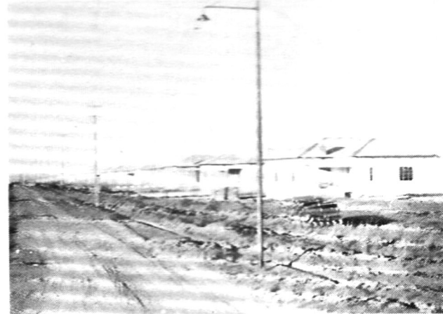
VAN DIE EERSTE HUISE IN CARLETONVILLE, UITBREIDING NR. EEN

water voorsien nie. 23 Toe die elektrifisering van spoorlyne in die vooruitsig gestel is, is in 1948 begin met die beplanning van 400 huise vir Welverdiend om spoorwegpersoneel te huisves 24 - 'n stap wat vooruitgang vir dié dorp beteken het.